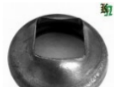
Переходник на трубу, арт. 8.764040 д=76мм, переход на кв.40x40 Вес: 0.23 кг Цена: 115 руб.