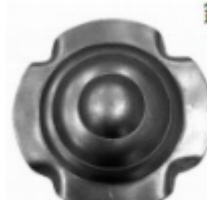
Декоративный колпачок, арт. 8.927 д=54x1,5мм Вес: 0.03 кг Цена: 20 руб.