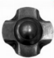
Декоративный колпачок, арт. 8.924 д=45x1,5мм Вес: 0.02 кг Цена: 21 руб.