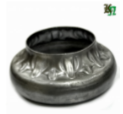
Переходник на трубу, арт. 8.877