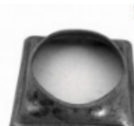
Переходник на трубу, арт. 8.606042 кв.60x60мм, переход на д=42x2мм Вес: 0.04 кг Цена: 44 руб.