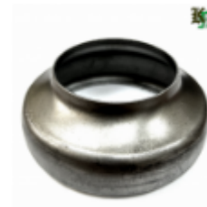
Переходник на трубу, арт. 8.10876