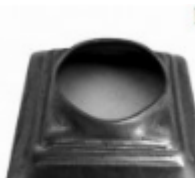
Переходник на трубу, арт. 8.808042 кв.80x80мм, переход на д=42x2мм Вес: 0.11 кг Цена: 59 руб.