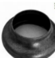
Переходник на трубу, арт. 8.7657 д=76мм, переход на д=57мм Вес: 0.23 кг Цена: 109 руб.