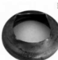
Переходник на трубу, арт. 8.1026060 д=102мм, переход на кв.60x60мм Вес: 0.31 кг Цена: 150 руб.