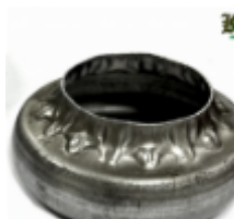
Переходник на трубу, арт. 8.878 д=76мм, переход на д=57мм Вес: 0.15 кг Цена (за шт): 123 руб.