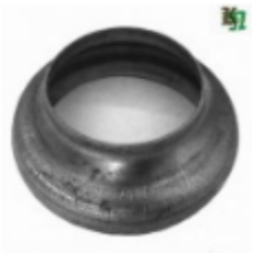
Переходник на трубу, арт. 8.10276