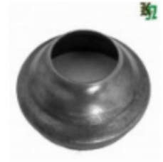
Переходник на трубу, арт. 8.8942