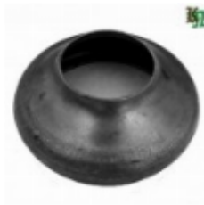
Переходник на трубу, арт. 8.10257