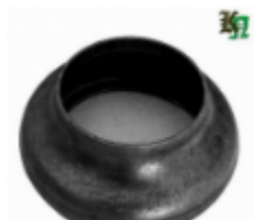
Переходник на трубу, арт. 8.5742 д=57мм, переход на д=42мм Цена (за шт): 105 руб.