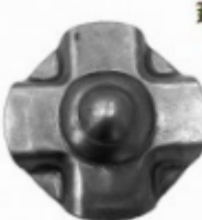
Декоративный колпачок, арт. 8.923 д=57x1,5мм Вес: 0.03 кг Цена: 18 руб.