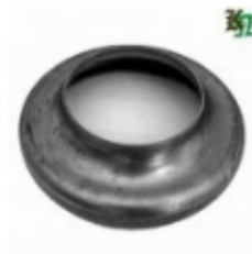
Переходник на трубу, арт. 8.159102