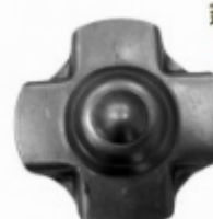
Декоративный колпачок, арт. 8.921 д=78x1,5мм Вес: 0.06 кг Цена: 30 руб.