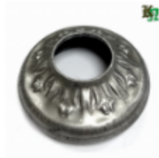
Переходник на трубу, арт. 8.5732