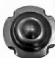
Декоративный колпачок, арт. 8.926 д=78x1,5мм Вес: 0.06 кг Цена: 25,50 руб.