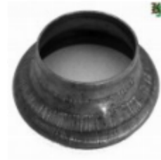
Переходник на трубу, арт. 8.8957