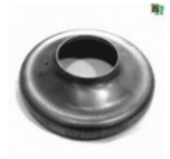
Переходник на трубу, арт. 8.15976