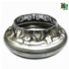
Переходник на трубу, арт. 8.883