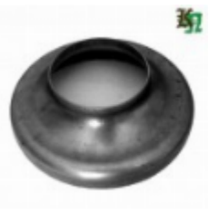
Переходник на трубу, арт. 8.15989