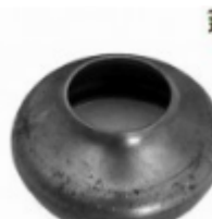
Переходник на трубу, арт. 8.7642 д=76мм, переход на д=42мм Вес: 0.23 кг Цена: 110 руб.